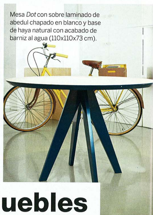
Mesa Dot con sobre laminado de abedul chapado en blanco y base de haya natural con acabado de barniz al agua (110x110x73 cm).