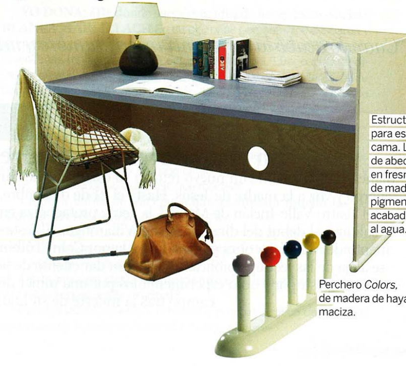
Estructura Flip para escritorio o cama. Laminado de abedul chapado en fresno y base de madera pigmentada con acabado de barniz al agua.