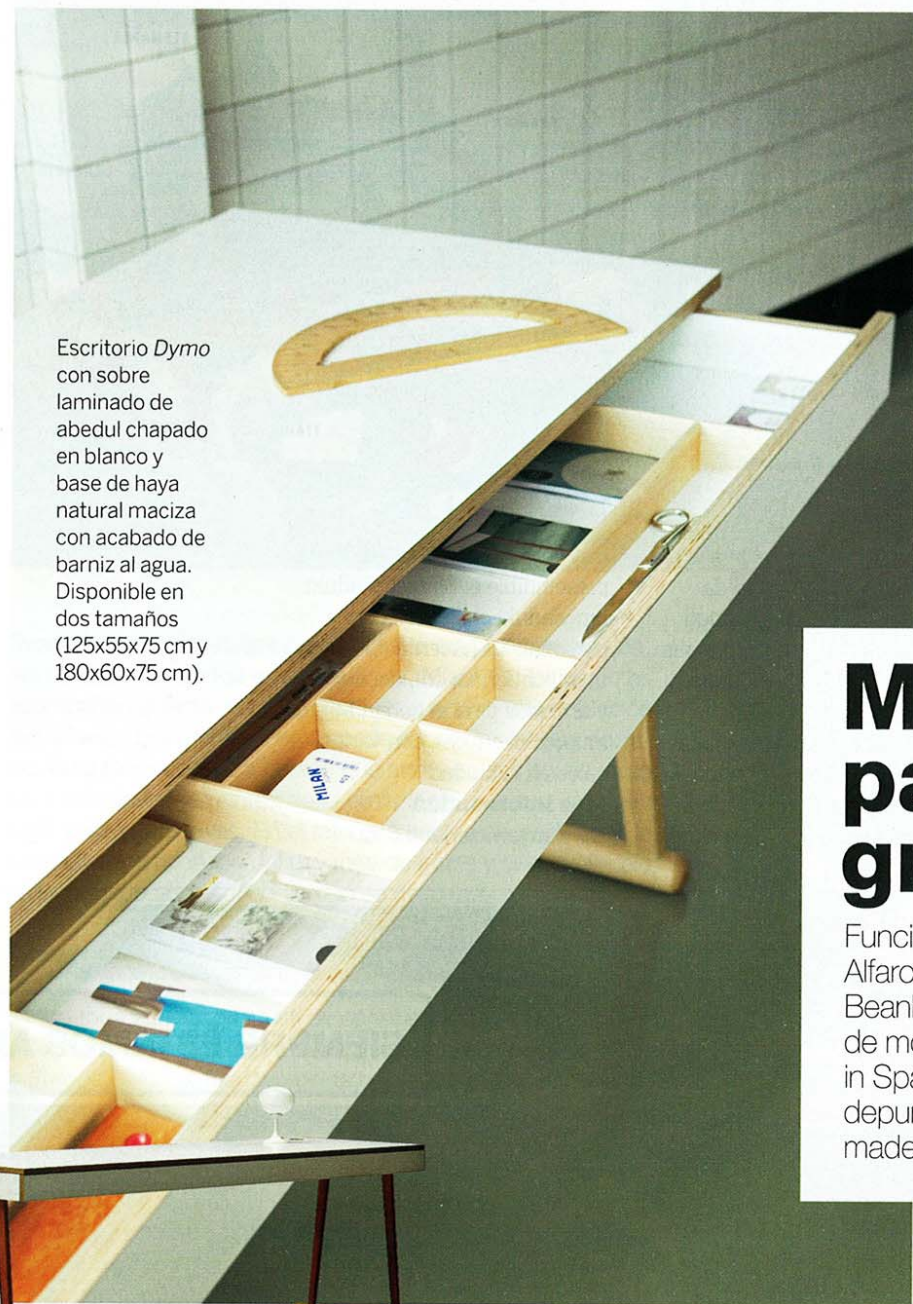
Escritorio Dymo con sobre laminado de abedul chapado en blanco y base de haya natural maciza con acabado de barniz al agua. Disponible en dos tamaños (125x55x75 cm y 180x60x75 cm).