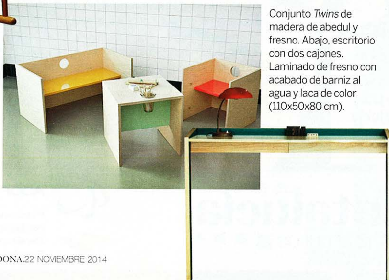
Conjunto Twins de madera de abedul y fresno. Abajo, escritorio con dos cajones. Laminado de fresno con acabado de barniz al agua y laca de color (110x50x80 cm).

Realización Cruz Faber Texto Teresa Iturralde